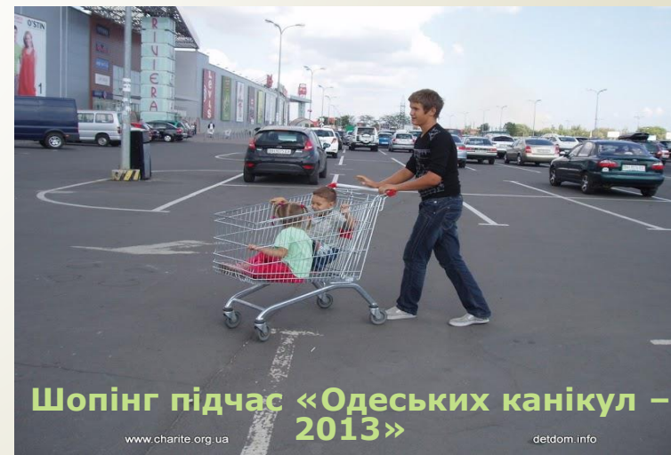
Шопінг підчас «Одеських канікул – 2013»