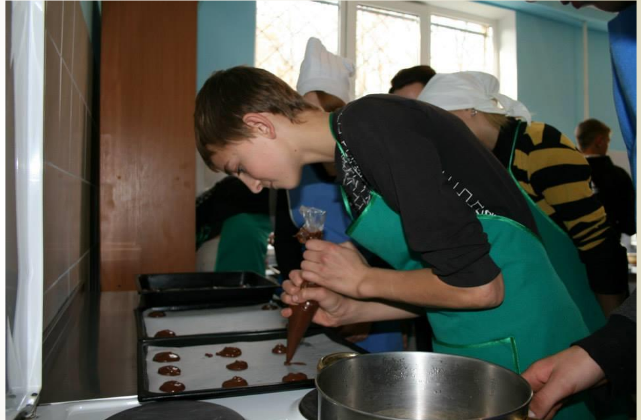
Кулінарний майстер-клас для майбутніх поварів у Васильківському ПТУ-інтернаті організатор БМ «Ласка»