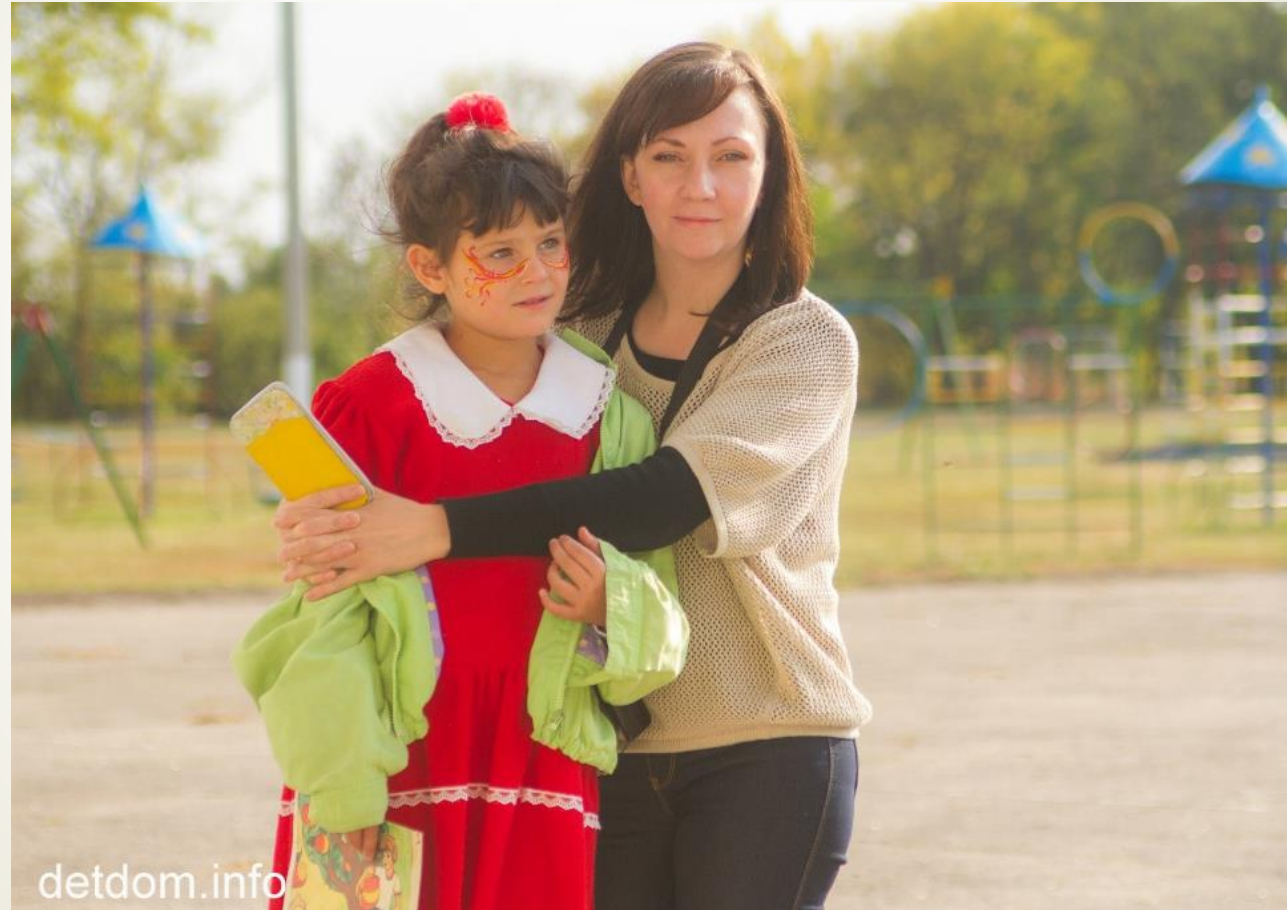
Шеф з підопічною у Андріївській школі-інтернат